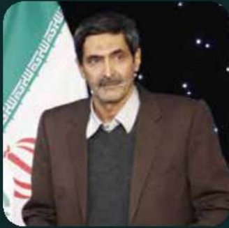
منوچهر منطقی رئیس کنفرانس